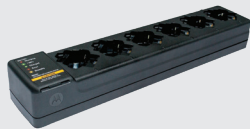
PMLN7102 / PMLN7162