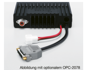
Abbildung mit optionalem OPC-2078

Zur Steuerung des NF-Ausgangs, des Modulationseingangs, zur Fernbedienung, zum Steuern eines Signalhorns und für viele weitere Funktionen stehen optionale Zubehörcable zur Verfügung. Das OPC-1939 ist die Sub-D-15-Pin-Ausführung und das OPC-2078 die 25-polige Variante des Kabels.